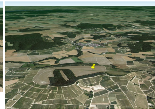
Fiche générée le 12/04/2023