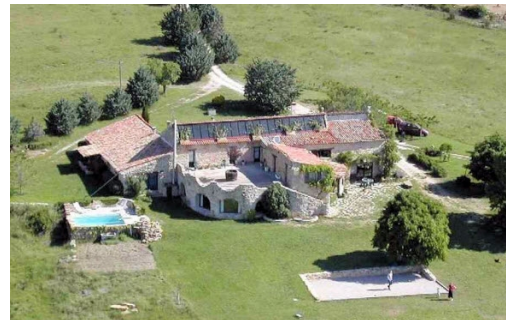
Fiche générée le 18/04/2023