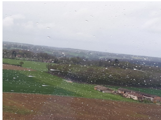
Fiche générée le 09/01/2023